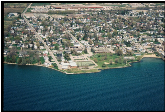
Prise d'eau de Prescott

La prise d'eau municipale de la ville de Prescott est située à l'ouest des limites du village, au bout de la rue Sophia, dans le fleuve St-Laurent. L'eau brute est prélevée à environ 2,3 m du fond de la rivière. La profondeur normale de l'eau au-dessus d'une prise d'eau est évaluée à environ 5,5 m. Le fond de la prise d'eau est à environ 105 m du rivage. L'Agence ontarienne des eaux (AOE) exploite le système de traitement de l'eau de Prescott qui dessert environ 3 900 résidents habitant dans Prescott et dans une petite section de Edwardsburgh / Cardinal.