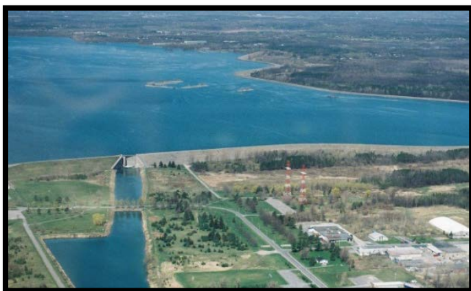
Prise d'eau de Cornwall

L'approvisionnement en eau de la Ville de Cornwall provient d'un petit lac dans le fleuve Saint-Laurent (Lac Saint-Laurent). La prise est située dans la face ouest du Barrage RH Saunders, dans la structure du Digue de Cornwall. La profondeur de l'eau au-dessus de la prise est de 15 mètres. L'eau brute est tirée par force de gravité à partir de la prise jusqu'à l'usine d'épuration d'eau, située à 3 km à l'est de la prise. Détenu et exploité par la Ville de Cornwall, l'usine de traitement d'eau de Cornwall dessert une population de plus de 47 000 habitants et comprend des services aux communautés de Rosedale Terrace et St. Andrew's West.