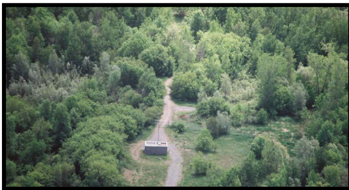
Têtes de puits de Chesterville

Le système municipal d'approvisionnement en eau potable est constitué d'un puits de production et d'un puits de réserve. Les puits appartiennent au canton de Dundas Nord et sont exploités par l'Agence ontarienne des eaux (AOE). Ce système dessert une population d'environ 1 560 et est situé à environ 3,8 km à l'ouest du village de Chesterville et à 200 m au nord du chemin 43.